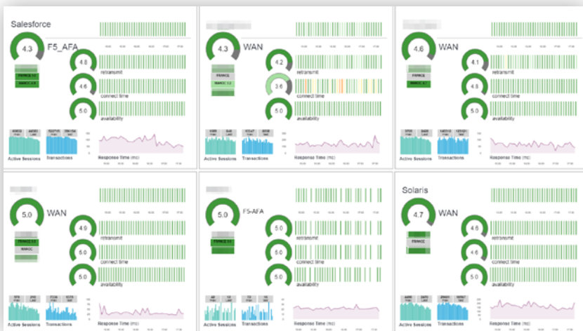
Restitution des données d'une solution EUEM en mode Dashboard interactif (troubleshooting)