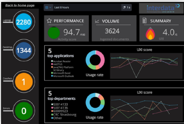
Restitution des données en mode Cockpit